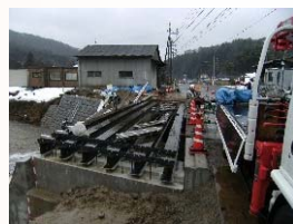
桁下面型枠設置状況