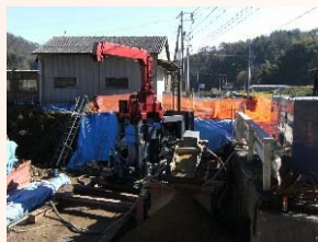
基礎杭の打設状況