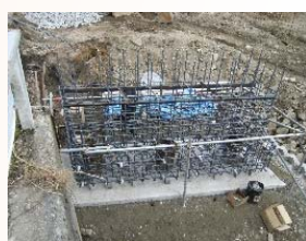
橋台鉄筋組立状況