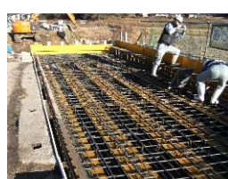
桁上面鉄筋組立状況