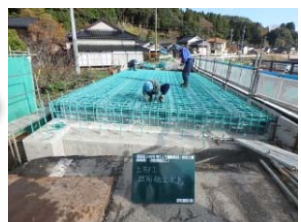
桁上面鉄筋組立状況