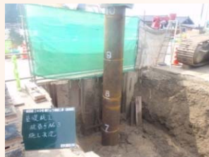
基礎杭の打設状況