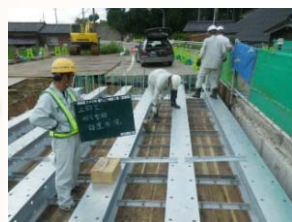
桁下面型枠設置状況