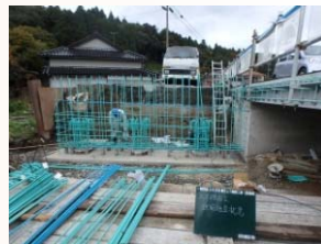
橋台鉄筋組立状況